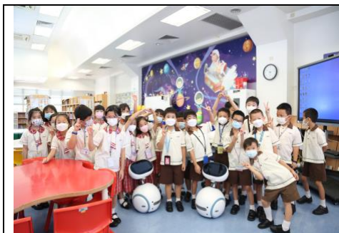
同學們開心興奮地遊校園

一年級同學先在老師帶領下遊遍校園每一個角落，重新欣賞及探索學校，找出自己最愛的校園設施，並運用「創意八式」建議學校進行改善工程，最後畫出理想的校園設計圖。