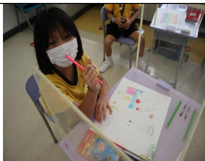
認真思考並設計理想中的校園